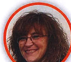
MARIANGELA MAPELLI SCUOLA PRIMARIA