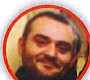
ROBERTO ZOLLO SCUOLA PRIMARIA